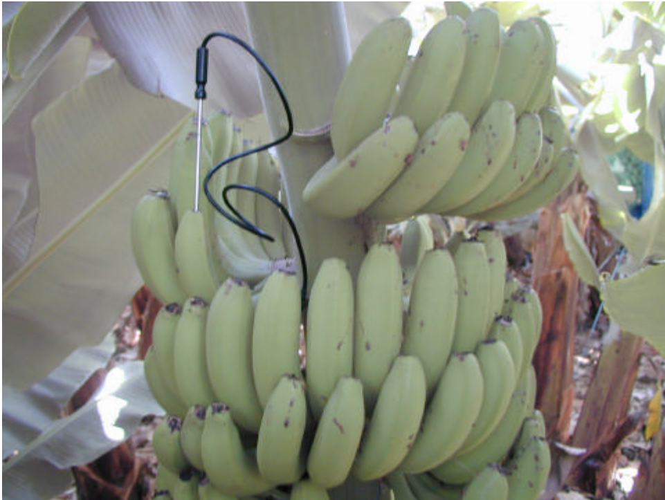
Detalle de la colocación del termómetro en la segunda mano superior. Fruta sin embolsar.

La temperatura media al aire libre medida en la estación agrometeorológica de Playa San Juan en el mismo periodo fue de 21,4°C situada a 3.184 metros del ensayo de corte.