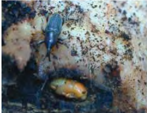
Adulto y pupa de picudo

apical, lo cual causa la muerte de las plantas. La mayoría de las galerías están situadas en la periferia del cormo, en la zona cortical.