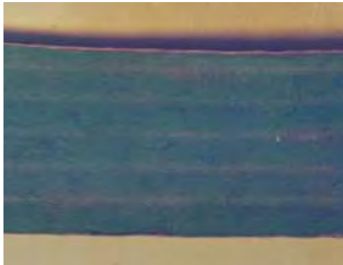
Araña roja en limbo

Es mejor utilizar una buena combinación de depredadores. Así, a comienzos de primavera o cuando exista poca incidencia de plaga se debería de utilizar Amblyseius californicus . Si la plaga está extendida, se deberá usar una mezcla de ácaros depredadores. En caso de incidencia grave de plaga, se podría realizar la suelta de los tres depredadores para un rápido descenso de las poblaciones de araña roja.