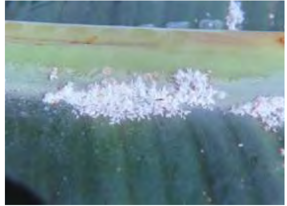
Diferentes estadios de lapilla en envés de la hoja