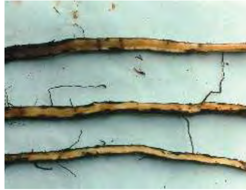
Raíces atacadas por nemátodo del género Pratylenchus