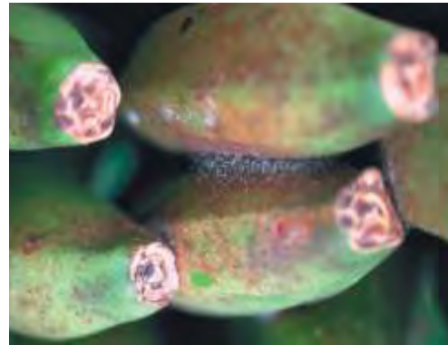
Araña roja en fruto