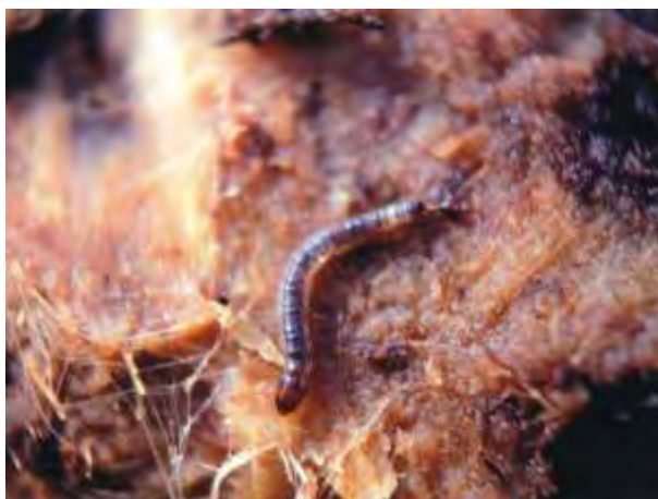
Larva de taladro

Las larvas son largas, de hasta 3 cm., con el cuerpo cilíndrico con un ligero estrechamiento justo después de la cabeza, de color blanco sucio con manchas oscuras en cada uno de los segmentos. La cabeza es marrón brillante.