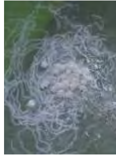
Detalle de puesta con larvas en diferentes estadios