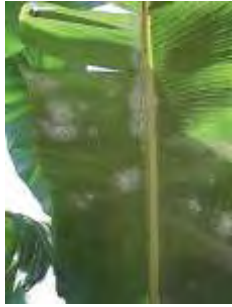
Puestas de mosca blanca en hoja de platanera