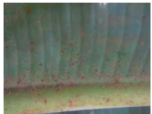
Ataque de pulgón en limbo

Como daño indirecto está la transmisión de virosis. En Tenerife sólo está presente el CMV y no el "bunchy top". La incidencia de virosis es muy baja y se suele dar en plantaciones nuevas con plantas procedentes de cultivo in vitro.