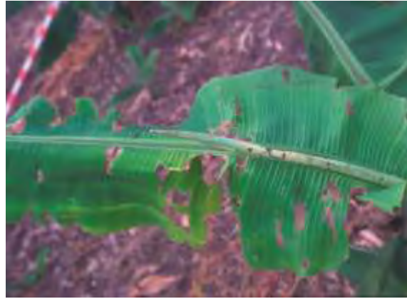
Daño de lagarta en hoja