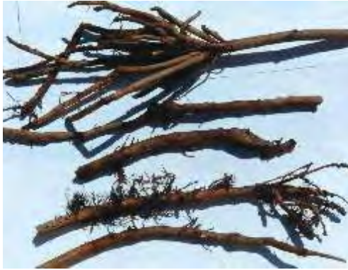
Raíces afectadas por nemátodo del género Meloidogyne