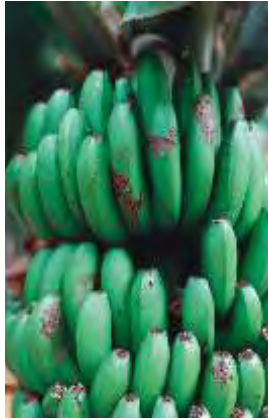
Daño de lagarta en fruto