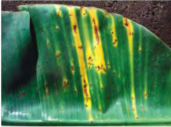
Amarilleo en hoja producido por lapilla