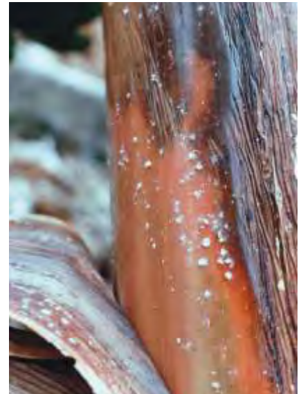
Cochinilla en rolo

Existen enemigos naturales de la cochinilla que se comercializan en Tenerife. Entre ellos destacamos: