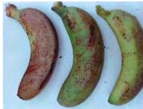
Trips en fruto

Hercinothrips femoralis se localiza en los frutos y en la bellota (ocasionalmente en el envés de las hojas). En los frutos se observan zonas de color plateado con pequeños puntos negros que se corresponden con excrementos de trips. Estas manchas pasan luego a una coloración pardo cobriza. Dichas manchas deprecian de forma notable el fruto. Las poblaciones de este insecto se inician, principalmente, en zonas sombrías o cercanas a muros altos.