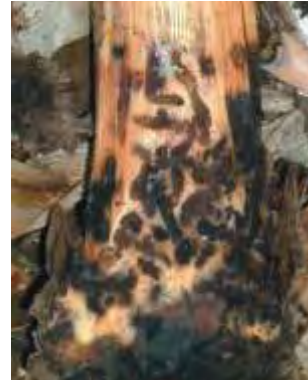
Daños en cormo ocasionados por picudo