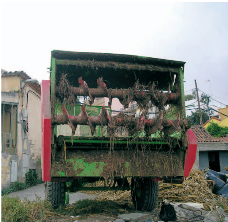
Repartidor de estiércol

económico menor. Para esta labor, se realiza un seguimiento permanente de las explotaciones agrícolas y ganaderas integradas en el programa, lo que incluye el análisis y tratamiento de datos relativos a la explotación. Se organizan reuniones periódicas con asistencia de agricultores y ganaderos en las que se han establecido las bases de la colaboración. En dichos encuentros, se planifica y organiza por parte de COAG, conjuntamente con los interesados, la recogida, transporte y distribución de los estiércoles y purines de cada zona. Paralelamente, se imparte una formación continuada en el tiempo sobre aquellas cuestiones directa o indirectamente