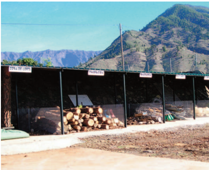
Zona de almacenamiento de residuos de la ECA de Los Llanos de Aridane.

Estos datos informarían aproximadamente sobre el potencial a gestionar. Pero, sin duda, serán muy superiores al volumen real que se gestionaría durante una operación determinada.