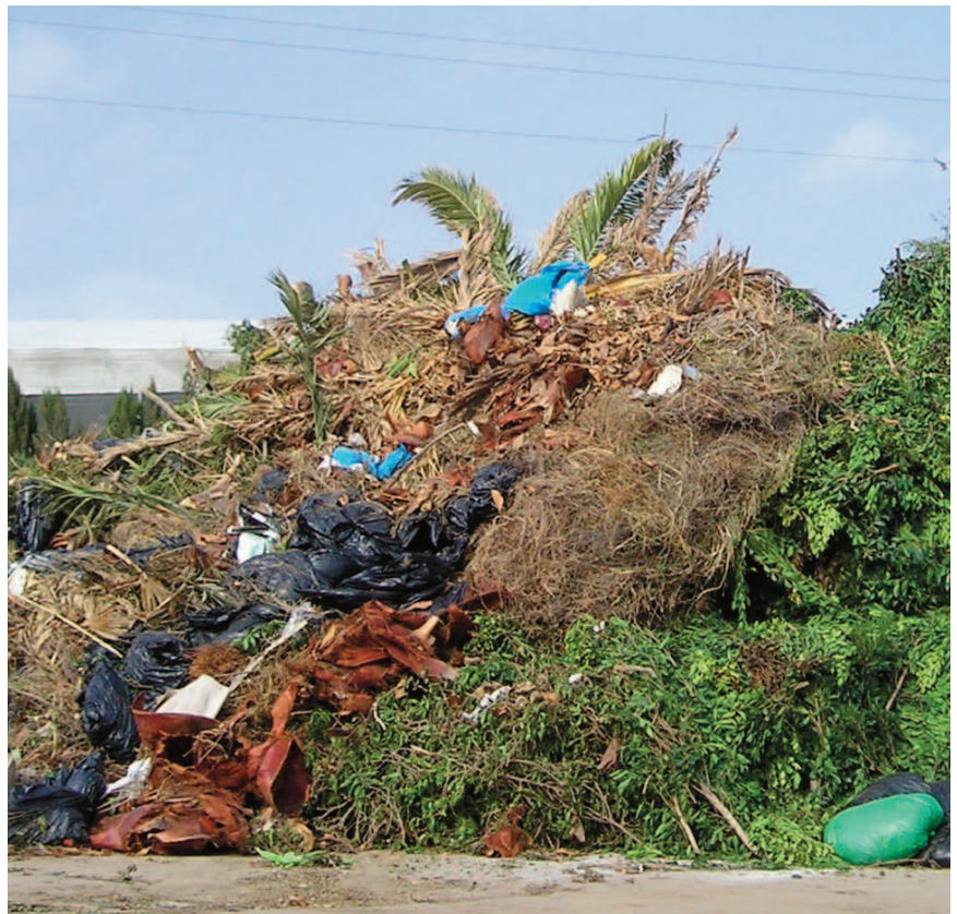
Restos de parques y jardines mal separados.