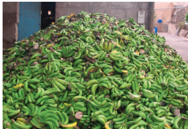
Destrío de plátano de un empaquetado, utilizado como alimento para animales.

Más allá de la consideración legal de residuo o subproducto, es importante resaltar que en determinados casos, lo que para uno es un residuo, para otro es materia prima. Esto se da especialmente para los metales y los plásticos reciclables, cuyo valor depende en buena parte del mercado de la materia prima virgen. Si bien a efectos económicos se trata de un subproducto, a nivel legal sigue siendo residuo, sometido por lo tanto a la normativa vigente.