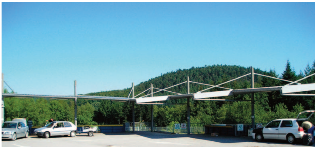
Punto Limpio de Arches, donde se pueden depositar la mayoría de los residuos agrícolas y ganaderos.

En 2005 se pone en marcha el sistema, SOVODEB, que permite a las PYMES, los artesanos, las pequeñas industrias, los agricultores y los ganaderos depositar sus residuos, aprovechando las infraestructuras y el personal existentes de los Puntos Limpios. Una gran ventaja del dispositivo es permitir la entrega de forma continua, en los horarios de apertura de los Puntos Limpios.