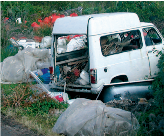
Vertidos incontrolados en zona rural.