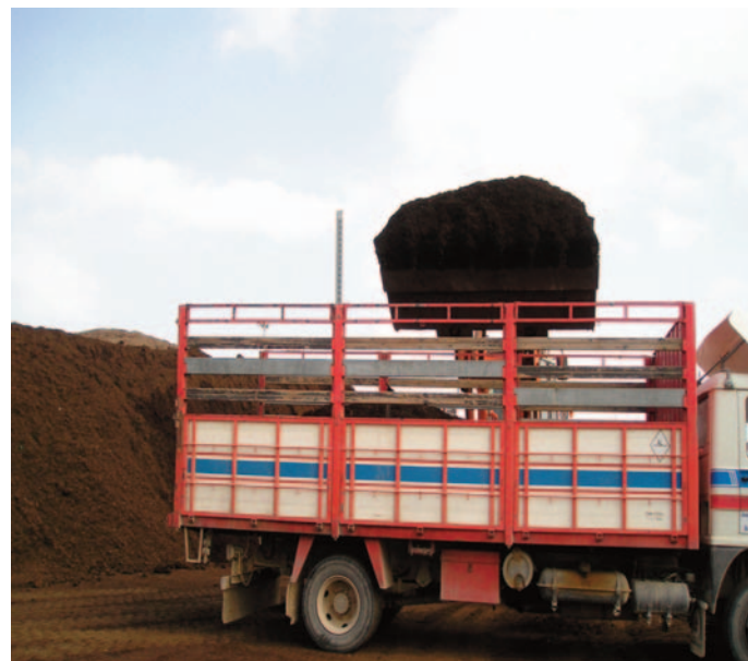
Carga del compost a granel.

Se vende a 10 €/m 3 a granel en 2007. La demanda de compost va en aumento, a la par del auge de la agricultura ecológica.