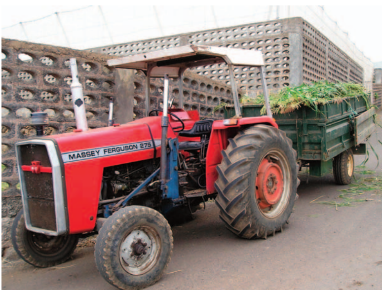
Transportando residuos vegetales.

Hasta que no se modifique la legislación regional, la posibilidad de transferir la titularidad de los residuos agrarios hacia otras entidades es la vía más pertinente para evitar los problemas ligados al transporte. Esta posibilidad ya existe entre las cooperativas y los agricultores, cuando están asociados. Queda por estudiar si esta transferencia podría realizarse con los ayuntamientos.