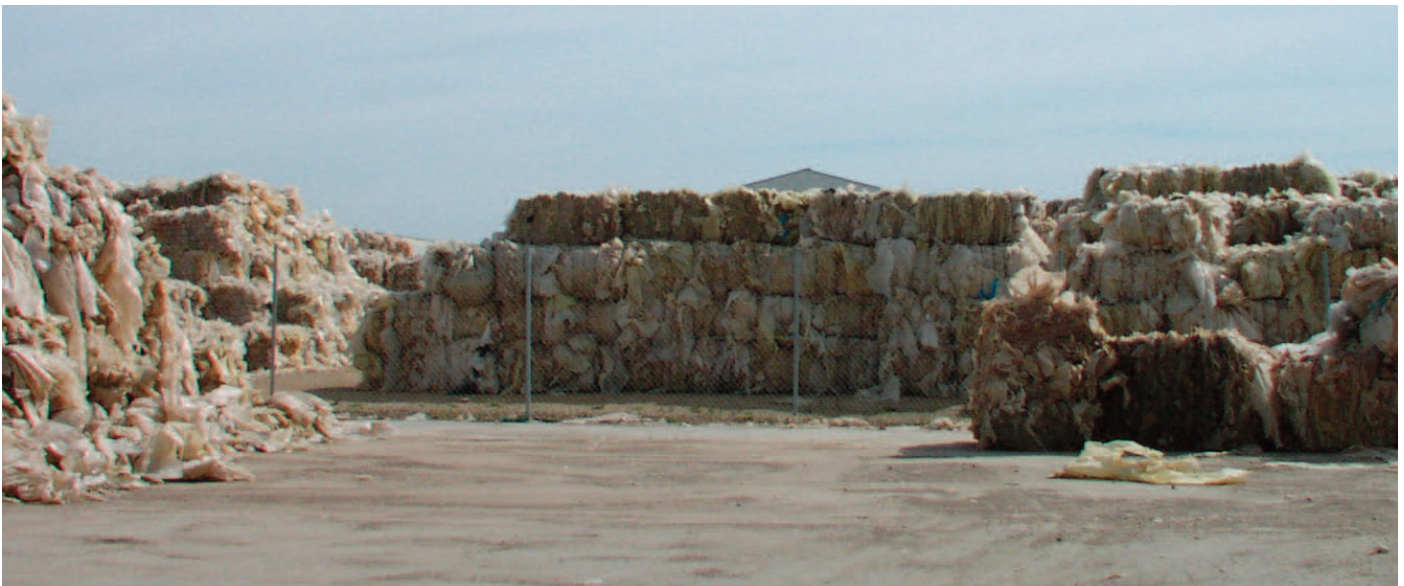
Balas de plásticos preparadas en las instalaciones de un transformador.

En Canarias, al no haberse realizado ninguna operación, es probable que existan muchos residuos almacenados, a la espera de una solución. La situación seguramente varía según las zonas de las Islas. Este punto puede ser investigado en el marco de la encuesta cualitativa