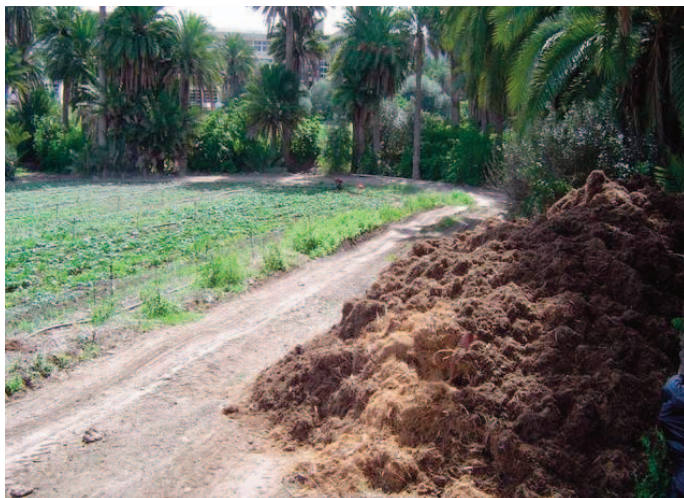
Estiércol pendiente de ser integrado al suelo.

Para el ganadero, la retirada de estiércoles y purines supone eliminar un grave problema para su explotación, por lo que pone todos los medios para facilitar su recogida. Los ganaderos están entregando de manera gratuita el material, existiendo diferentes alternativas para el transporte y distribución. En el caso del suero de leche, se han cerrado acuerdos con dos queserías que lo entregan gratuitamente a los agricultores, solucionando a su vez el problema que tenían para su eliminación.