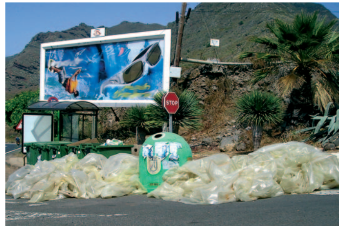
Vertido de residuos agrícolas junto a contenedores de recogida de residuos domésticos.

al sistema de gestión individual. De esta manera, se facilitaría al sector agrario que cumpliera con la legislación, contribuyendo a que siga siendo elegible para las ayudas europeas y a que mantenga sus producciones en los mercados, tanto para la agricultura de exportación como para la de mercado interior.