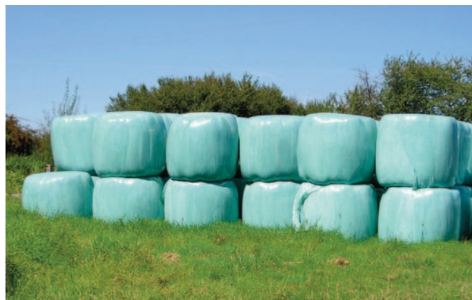
Balas de forraje ensilado.

Durante una semana, los agricultores podían depositar sus residuos plásticos debidamente separados. Cada uno llevaba sus plásticos prensados, gracias a la prensa que suelen incluir los tractores de pacas de paja. El dueño de la finca apuntaba los nombres de los agricultores, para posteriormente comunicarlos a la Cámara, encargada de emitir los documentos justificativos de la gestión.