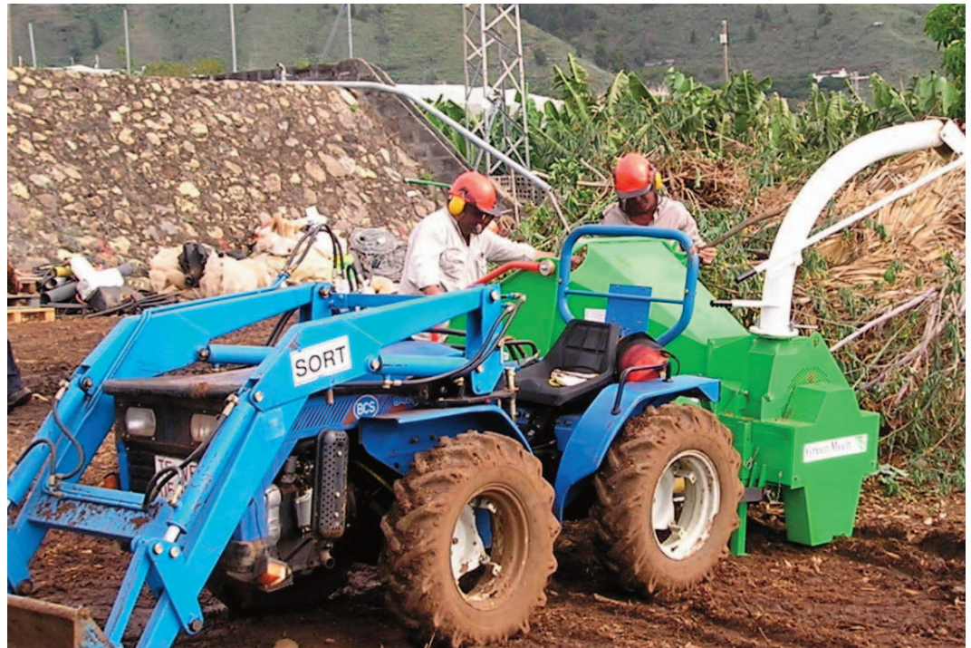
Peones realizando la trituración de restos vegetales.

Darse de alta para el transporte de residuos peligrosos es un trámite más complejo ya que se requiere poseer además un seguro de responsabilidad civil y cumplir con todas las normas de transporte de mercancías peligrosas.