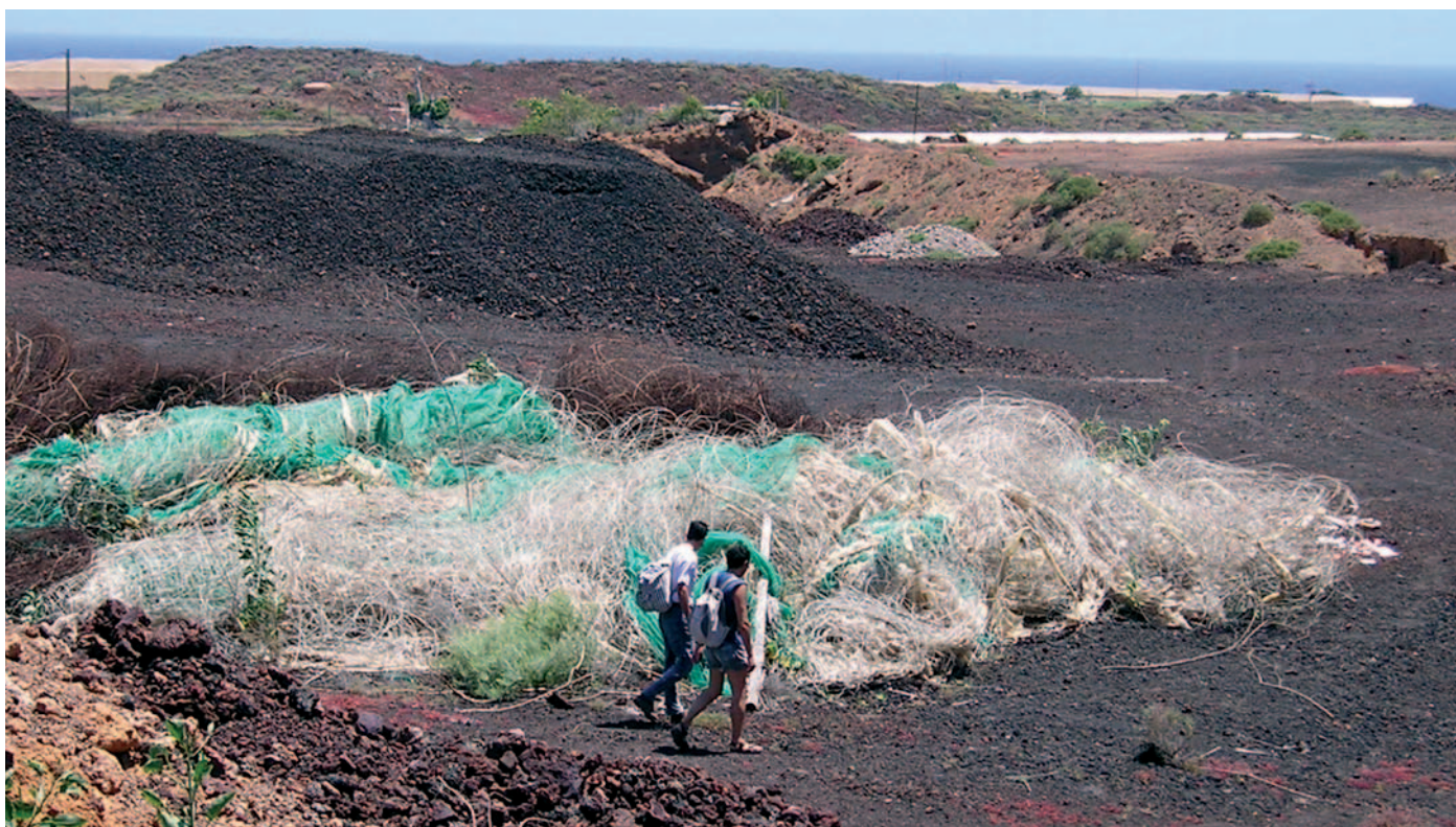
Residuos agrícolas en un espacio protegido.

➡ Reducir el abandono de los residuos implica una mejora de las zonas rurales y de los espacios naturales protegidos, muy valorados por el turismo, en términos paisajísticos y de protección de los recursos.