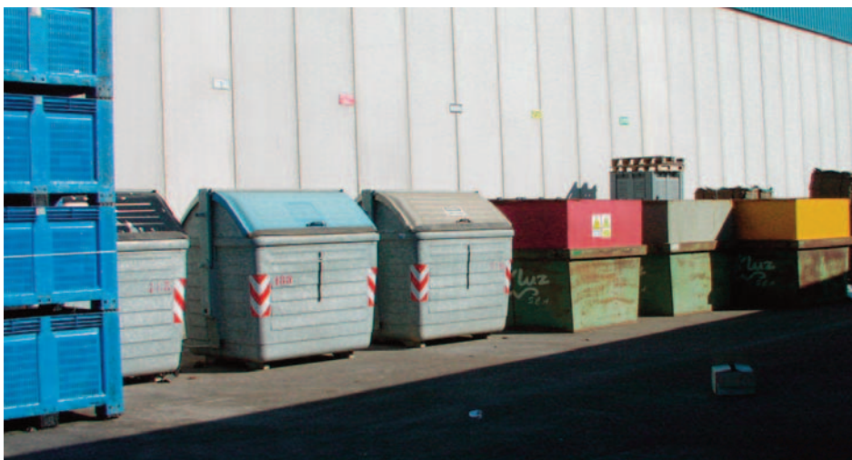
Contenedores en el interior de una cooperativa, donde se depositan los residuos de los agricultores y del proceso de empaquetado.

Con el tiempo, los agricultores han adquirido contenedores de almacenamiento, ayudados por los fondos operativos de la OCM de frutas y hortalizas. El sistema municipal ha ido reduciendo su importancia a favor de los gestores transportistas, que llevan cerca del 80% de los residuos a la planta. Paralelamente a estos dos sistemas, las cooperativas se han equipado de contenedores para acopiar los residuos derivados del empaquetado.