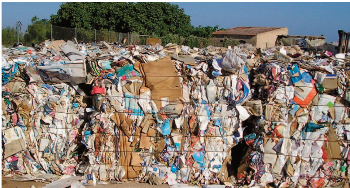
Balas de papel y cartón.

A pesar del coste que supone para el Ayuntamiento, éste sigue apostando por una planta con acceso gratuito con el fin último de conservar unos paisajes de gran valor – parte del territorio municipal está incluido en el Parque Natural de la Sierra de Escalona y Dehesa de Campoamor, declarado Lugar de interés comunitario (LIC) de la Red Natura 2000 – y preservar la actividad agrícola junto con la turística.