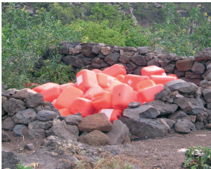
Almacenamiento de bidones de ácido.

➡ En resumen, realizar acciones para la mejora de la gestión de residuos presenta, indudablemente, un interés público y colectivo, y contribuye a una mejora de la imagen de la entidad por parte de la población en general y de la agrícola en particular.