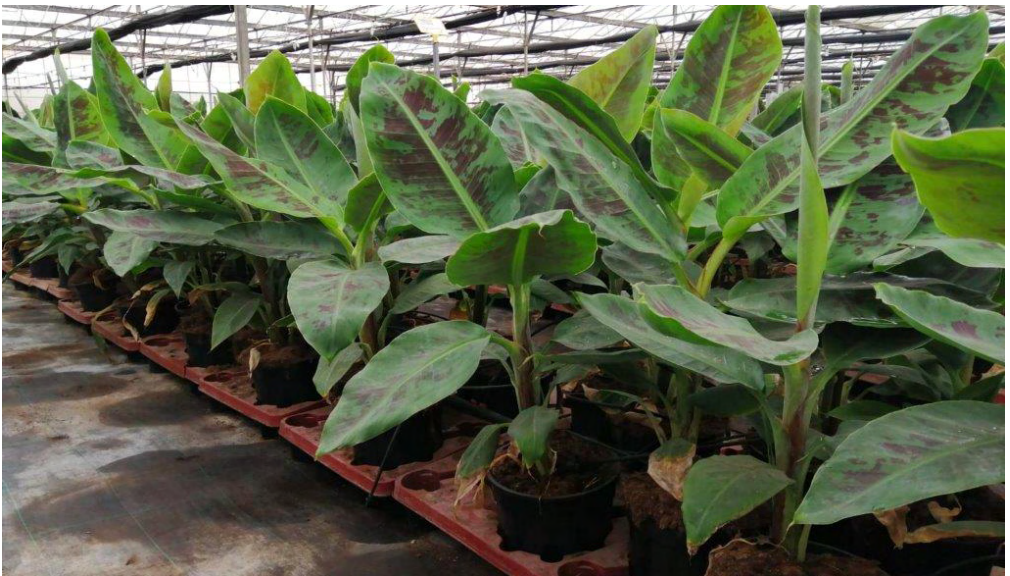
Foto 2.- Planta de vivero

Plantas procedentes de cultivo “in vitro”. Las ventajas en el uso de este material son varias: mayor garantía sanitaria y varietal (libre de plagas y enfermedades), disponibilidad de plantas (procedentes de material seleccionado) en el momento que se quiera realizar las resiembras, con un tamaño homogéneo. Además de la facilidad en su manejo y bajo coste.