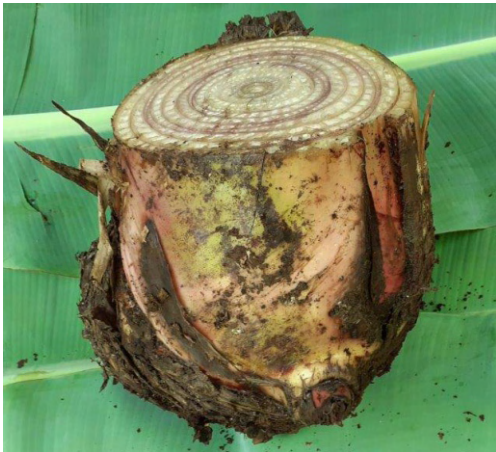
Foto 3.- Cabezas preparadas para resembrar

Los principales inconvenientes son: escasa disponibilidad de material para poder realizar todas las resiembras; igualmente es un medio de propagación de plagas y enfermedades, principalmente picudo y mal de Panamá. Por lo tanto, todo el material de plantación afectado debe eliminarse. Requiere mayor mano de obra para preparar las cabezas, siendo aconsejable recolectarlas como mínimo uno a dos meses antes para que se sequen los cortes y las heridas que se le producen. Es importante una selección previa, ya que no todo vale. Siempre debemos elegir plantas de buenos cultivos y no de cultivos mediocres o malos, tanta en el aspecto sanitario como productivo.