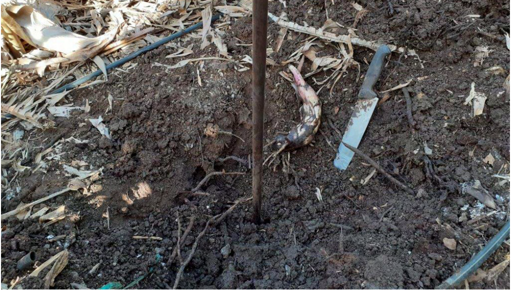
Foto 6.- Preparación del terreno, retirada de restos vegetales