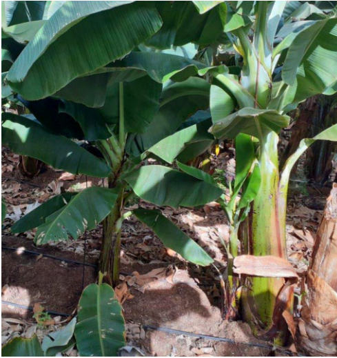
Foto 7.- Resiembra inadecuada por exceso de sombra de plantas vecinas