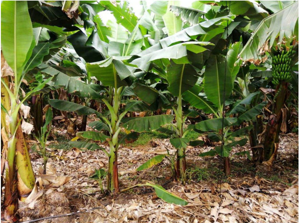
Foto 9.- Resiembras procedentes de material "in vitro", transcurridos seis meses de la siembra a principios de abril

maquinaria, técnicas de biosolarización, renovar el sistema de riego (si el coeficiente de uniformidad es inferior al 80%) y mejorar la propiedades físico químicas del suelo.