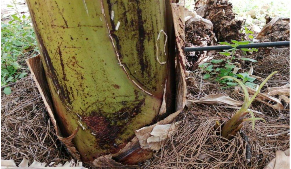
Foto 5.- Detalle de la hijería en plantas de resiembra

hijos se debería realizar de varios pases. Se aconseja el uso de deshijado químico para la eliminación de los hijos de fondo.