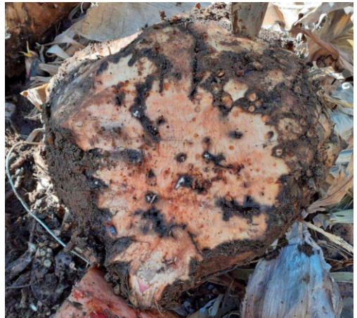
Foto 4.- Cabezas afectadas por picudo