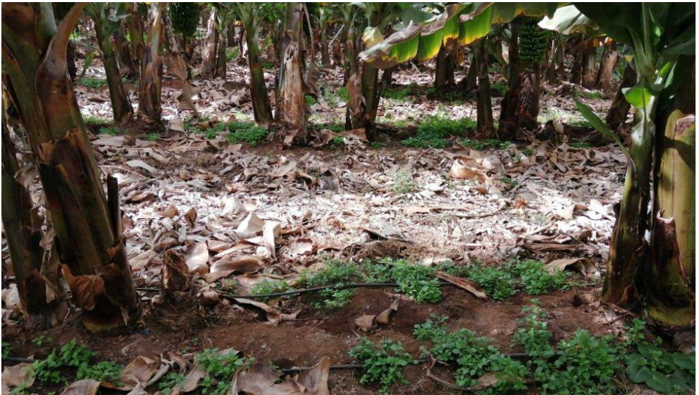
Foto 1.- Ubicación de la futura resiembra

Dentro de esta Hoja Divulgativa se pretende explicar la manera más correcta de realizar esta técnica, describir los diferentes tipos de material a utilizar, determinar las épocas más adecuadas en función de la zona de cultivo, el deshijado de las resiembras, el manejo del riego, las labores de cultivo asociadas a esta práctica y la viabilidad de dicha práctica.