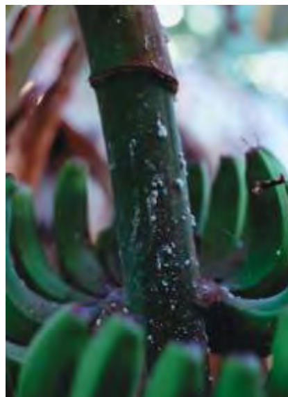
Cochinilla en racimo

El cuerpo de la hembra es oval y recubierto de una capa de cera blanca pulverulenta que le confiere un aspecto espolvoreado de harina. Desposeída de esta cera, su color varía desde un gris rosado a un rosado oscuro y su tamaño, también variable, puede alcanzar un máximo de 3 mm. La cochinilla algodonosa es móvil durante toda su vida porque posee tres pares de patas funcionales aunque sus movimientos son lentos sobre todo a partir de la puesta de huevos. Estos son de color anaranjado y depositados en ovisacos algodonosos blancos. Las hembras pasan por tres estados larvarios antes de formarse el adulto, los cuales sólo se diferencian en el tamaño. Los machos, muy pocos frecuentes, son alados.