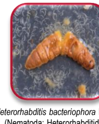
Heterorhabditis bacteriophora Poinar (Nematoda: Heterorhabditidae)

Lapilla Aspidiotus nerii Bouché (Hemiptera: Diaspididae)