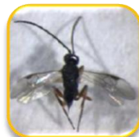
Cotesia spp. (Hymenoptera: Braconidae)