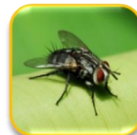
Exorista sorbillans Wiedemann (Diptera: Tachinidae)