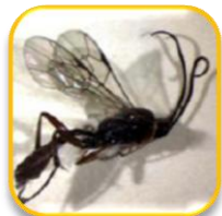
Hyposoter didymator Thunberg (Hymenoptera: Ichneumonidae)