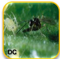
Aphidius colemani Haliday (Hymenoptera: Aphididae)