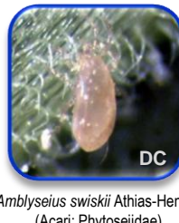
Amblyseius swiskii Athias-Henriot (Acari: Phytoseiidae)

Picudo negro de la platanera Cosmopolites sordidus Germar (Coleoptera: Curculionidae)