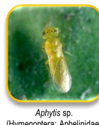
Aphytis sp. (Hymenoptera: Aphelinidae)