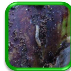
Lagarta de la platanera Opogona sacchari Bojer (Lepidoptera: Tineidae)