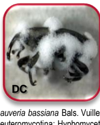
Beauveria bassiana Bals. Vuillemin (Deuteromycotina: Hyphomycetes)