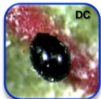
Delphastus catalinae Horn (Coleoptera: Coccinellidae)