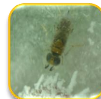
Acerophagus sp. (Hymenoptera: Encyrtidae)