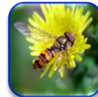
Episyrphus balteatus DeGeer (Diptera: Syrphidae)

Araña roja Tetranychus urticae Koch (Acari: Tetranychidae)