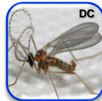
Aphidoletes aphidimyza Rodani (Diptera: Cecidomyiidae)