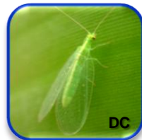
Chrysoperla carnea Stephans (Neuroptera: Chrysopidae)