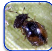
Scimnus cercyonides Woll. (Coleoptera: Coccinellidae)