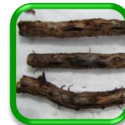
Nemátodo Pratylenchus goodeyi Cobb Helicotylenchus multicinctus Cobb Meloidogyne incognita Kofoid & White Meloidogyne javanica Teub