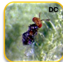
Trichogramma achaeae (Hymenoptera: Trichogrammatidae)