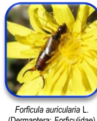
Forficula auricularia L. (Dermaptera: Forficulidae)

No se han encontrado en Canarias OCBs para las siguientes plagas: