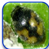
Nephus peyerimhoffii Sicard (Coleoptera: Coccinellidae)