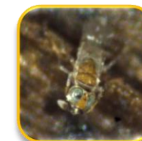
Acerophagus artelles Guerrieri & Noyes (Hymenoptera: Encyrtidae)

Moscas blancas espirales Aleurodicus dispersus Russell Aleurodicus floccosissimus Martin et al. (Hemiptera: Aleyrodidae)