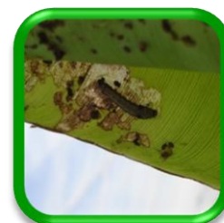
Lagarta Spodoptera littoralis Boisduval (Lepidoptera: Noctuidae)

No se han encontrado en Canarias OCBs para las siguientes plagas: