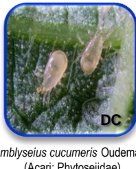
Amblyseius cucumeris Oudemans (Acari: Phytoseiidae)