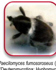
Paecilomyces fumosoroseus (Wize) (Deuteromycotina: Hyphomycetes)