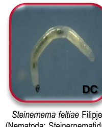
Steinemema feltiae Filipjev (Nematoda: Steinernematidae) © Koppert Biological Systems