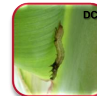
Bacillus thuringiensis var. thuringiensis Berliner (Familia Bacillaceae)

Pulgón Pentalonia nigronervosa Coquerel Aphis gossypii Glover (Hemiptera: Aphididae)