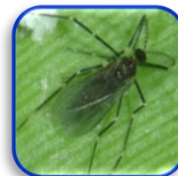
Dicrodiplopsis guatemalensis Felt (Diptera: Cecidomyiidae)