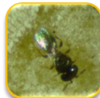
Allotropa musae Bull (Hymenoptera: Platygasteridae)