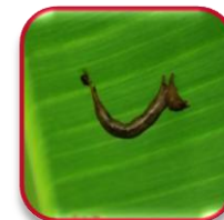
Nucleopoliedrovirus ChChSNPV (Familia Baculoviridae)