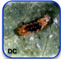
Feltiella acarisa Vallot (Diptera: Cecidomyiidae)