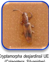
Cryptomorpha desjardinsii UER (Coleoptera: Silvanidae)