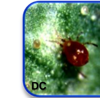
Phytoseiulus persimilis Athias-Henriot (Acari: Phytoseiidae)