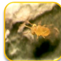
Encarsia hispida De Santis (Hymenoptera: Aphelinidae)