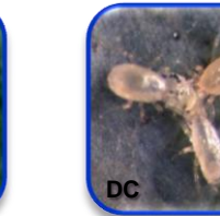
Amblyseius californicus Mc Gregor (Acari: Phytoseiidae)