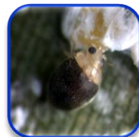
Nephaspis bicolor Gordon (Coleoptera: Coccinellidae)