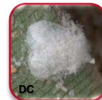
Beauveria bassiana Bals. Vuillemin (Deuteromycotina: Hyphomycetes)

Lagarta Chrysodeixis chalcites Esper. (Lepidoptera: Noctuidae)