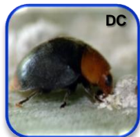
Cryptolaemus montrouzieri Suls. (Coleoptera: Coccinellidae)