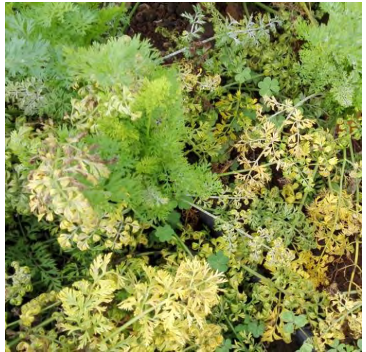
Síntomas de enfermedad en zanahorias: puntas rojas, amarillosos, multibrotaciones, acucharamiento foliar.