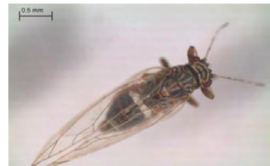
Huevo, ninfa, adulto recién emergido de la ninfa y adulto de Bactericera cockerelli ( https://gd.eppo.int ).