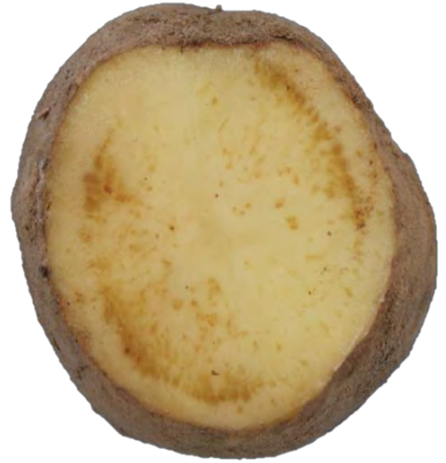
Centro de Investigación y Formación Agraria (CIFA), Cantabria

La composición de los carbohidratos en los tubérculos de papa infectados se modifica y, cuando se fríen, se forman bandas de material caramelizado o quemado en los cortes de papa, que se parecen a las rayas de las cebras, lo que ha dado nombre a la enfermedad.