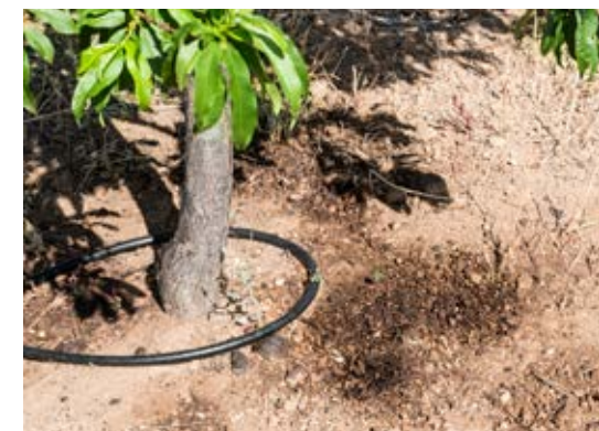
Mancha de melaza en el suelo producida por colonia de pulgones.