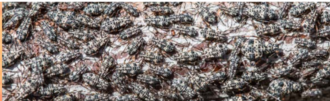
Colonia de pulgones sobre rama de melocotonero.

Se alimenta de la savia debilitando el árbol y provocando defoliación. En ataques severos puede llegar a secar la totalidad de la rama atacada. Estos pulgones excretan gran cantidad de melaza produciendo visibles manchas en el suelo y cubriendo también las partes verdes del árbol. Sobre dicha melaza se desarrolla el hongo negrilla que reduce la capacidad fotosintética