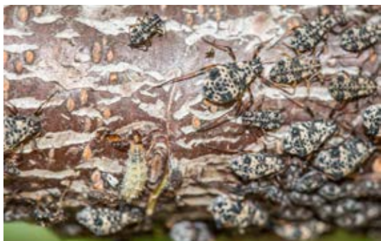
Ejemplos de enemigos naturales del pulgón negro de la madera (coccinellido y sírfido, respectivamente).

En la siguiente tabla se detallan los productos fitosanitarios autorizados en los principales cultivos frutales susceptibles a ser atacados por esta plaga.