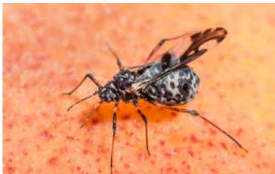
Pulgón negro adulto sobre fruto sin alas y con alas, respectivamente.

Son vivíparos, pero en regiones donde las temperaturas invernales son bajas, las últimas generaciones otoñales dan lugar a huevos de invierno que resisten el frío. En Canarias, donde los inviernos son suaves probablemente se reproducirán continuamente mediante hembras vivíparas.