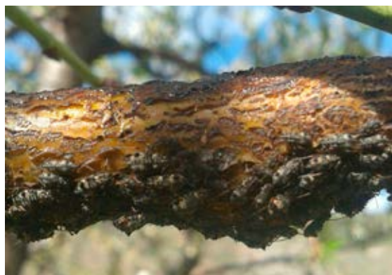
Melaza cubriendo la rama del árbol.

del árbol. Asimismo, es habitual encontrar este pulgón asociado con las hormigas que los defienden de sus enemigos naturales y ayudan a su dispersión.